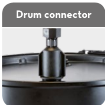
Code F19157000 Drum connector 2" BSP