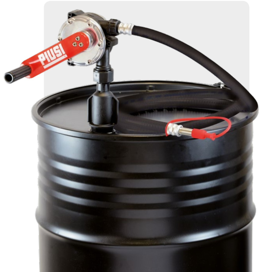
Rotative hand pump with delivery hose and stainless steel spout.