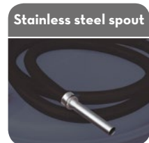
Code R1512800A F: 2" BSP - M: 70x6