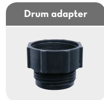
Code F15236000 F: 2" BSP - M: 56x4